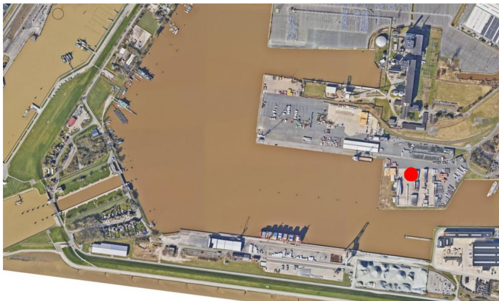
Abbildung 1 - Übersichtslageplan Hafen Emden - E36 Nordkai Ost